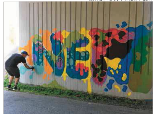
Puolet kyselyyn vastanneista nuorista on kiinnostunut katutai-teesta.

■ Soitetuin kotimainen kappale löytyy sijalta neljä. Se oli Reino Nordinin Antaudun 10 361 soitto-kerralla. Kymmenen kärkeen mahtui mukaan myös kaksi kappaletta Haloo Helsinkiä. Sijalla kuusi, 8 814 soitto-kerralla, oli bändin kappale Hulluuden Highway ja sijalla kymmenen, 7 588 soitto-kerralla, kappale Rakas.