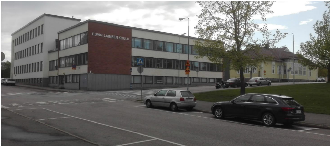
Kuva 3 Kuva otettu 2019

20. LÄHTEET (kirjallisuus, piirustukset, asiakirjat)