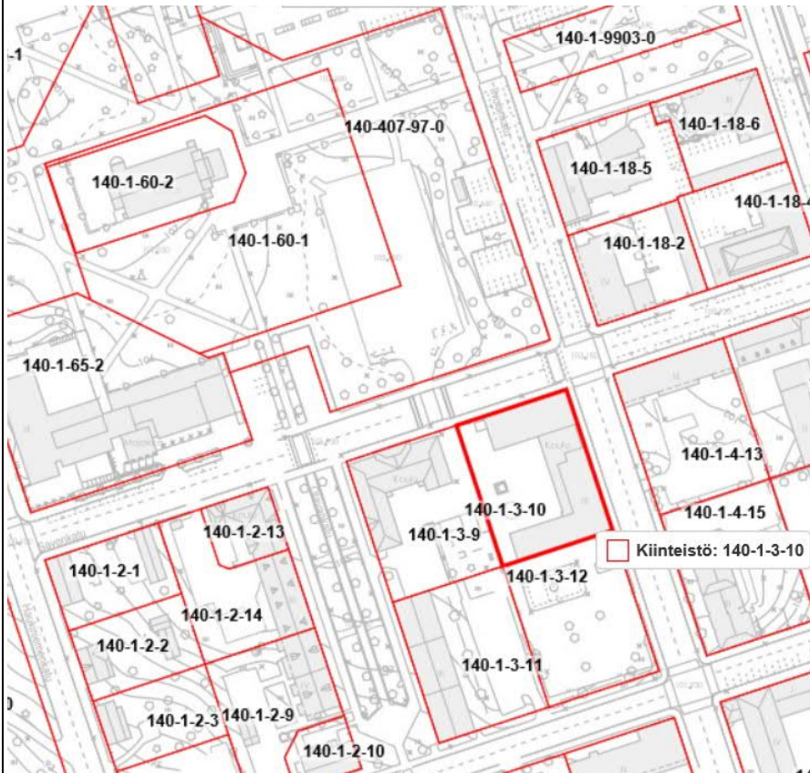
Kuva 1 Sijaintikartta (Iivolankadun ja Savonkadun kulmaus Kirkkoaukion eteläpuolella)