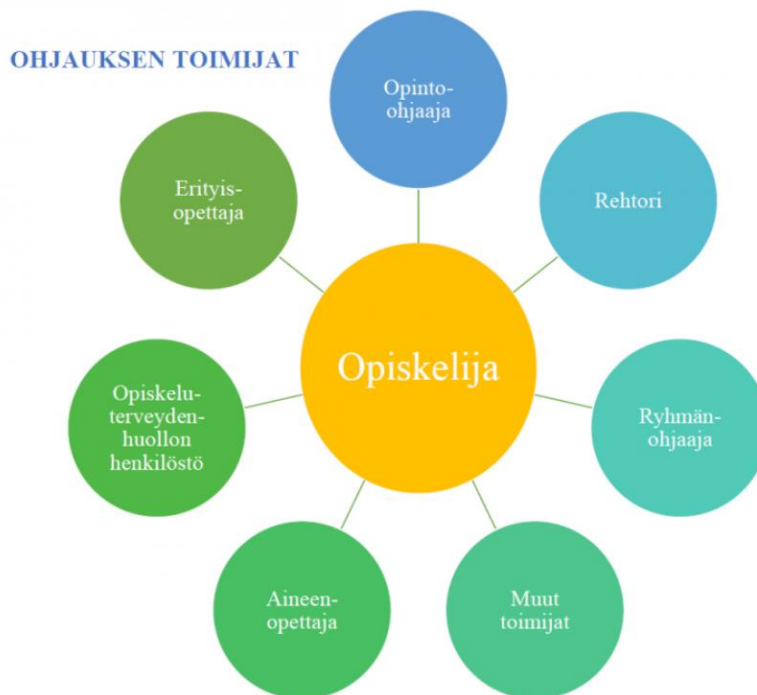
Kuva 1. Ohjauksen toimijat Iisalmen lyseossa

Iisalmen lyseossa ohjaukseen osallistuvat opinto-ohjaajat, aineenopettajat, ryhmänohjaajat, rehtori, koulu-sihtööri, erityisopettaja, koulukuraattori, terveydenhoitaja, MAHIS-opinto-ohjaaja ja opiskelijakunnan hallitus.