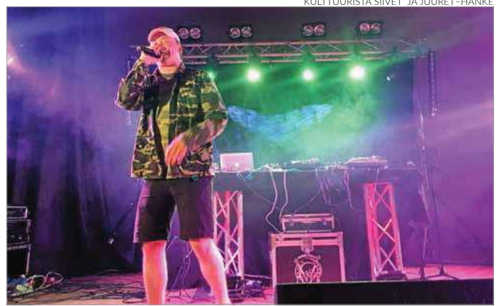
Puolet kyselyyn vastanneista nuorista on kiinnostunut keikoista ja konserteista. Pramatik oli keikalla Iisalmen Nuorisotalossa keväällä 2018.

Osa vastaajista sanoo, että koulussa järjestetyissä keskusteluissa on aina koulukonteksti sotke-massa ja sensuroimassa ajatuksienjuoksua. Nuorisohjaajaa toivotaan kou-