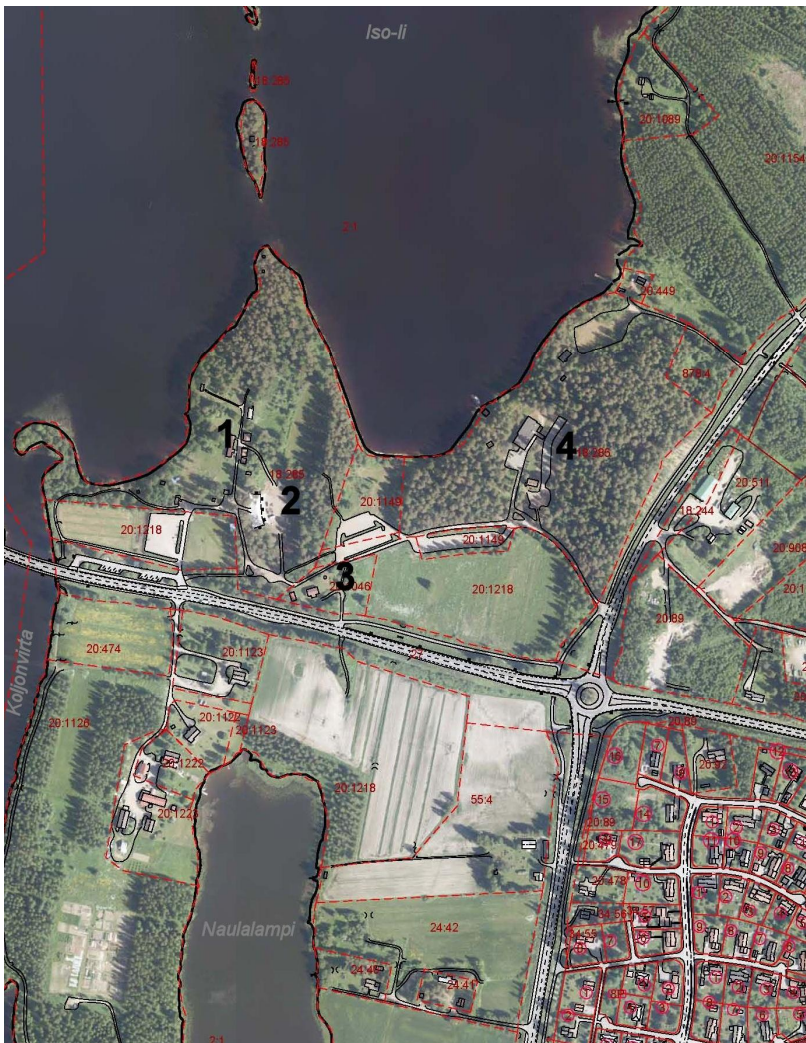
Mansikkaniemi ja Naulalammen ympäristö

Mansikkaniemi sijaitsee Pikku-lin vesistön, Ouluntien ja Vanhan Kainuuntien välisellä alueella. Alue on Iisalmen keskusta-alueesta 4-5 km pohjoiseen. Lähiympäristössä on mm. Pihlajaharjun ja Jordanin asuinalueet sekä Koljonvirran leirintäalue. Alueen eteläpuolella, osittain kaava-alueella (Naulalammen ympäristö), on harvaa pientaloasutusta ja mm. vanha maatila. Kaava-alueen pinta-ala on noin 29 ha. Alue on Mansikkaniemen alueen osalta rakennuskielossa kaavan laatimista varten.