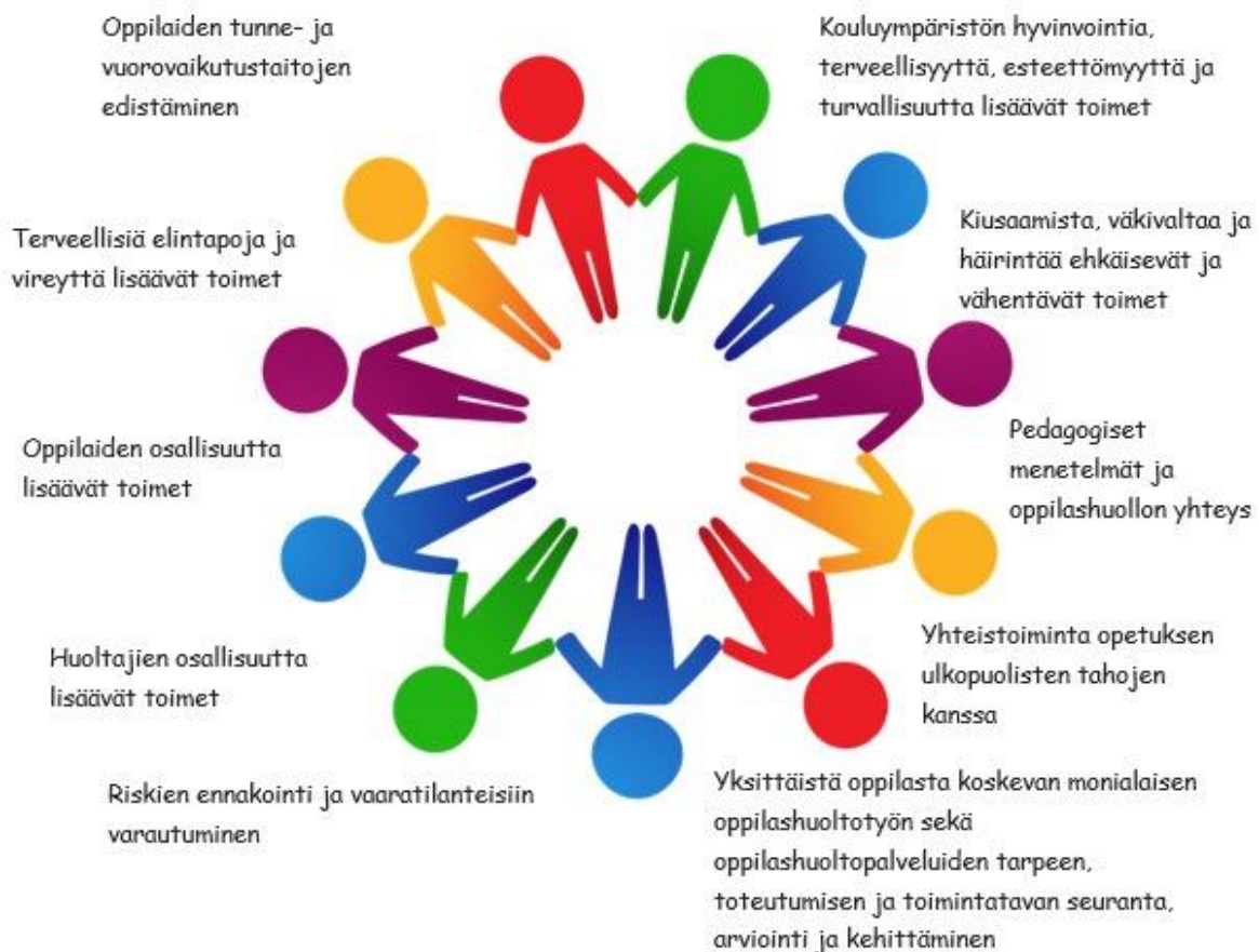
Kuvio 2. Yhteisöllisen oppilashuollon tehtävät