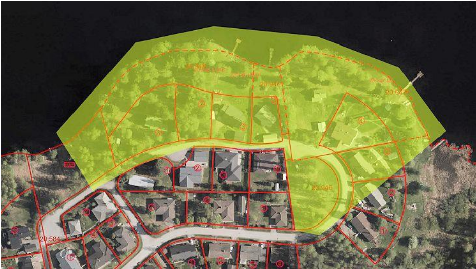
Kuva 7 Linkinniemen kartoitusalue.

Kartoituksessa ei löytynyt merkkejä liito-oravasta.