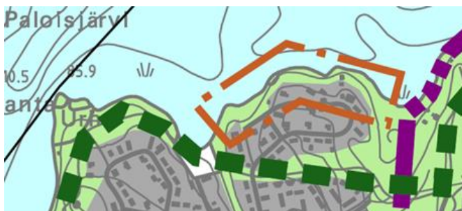
Kuva 5 Ote yleiskaavasta.