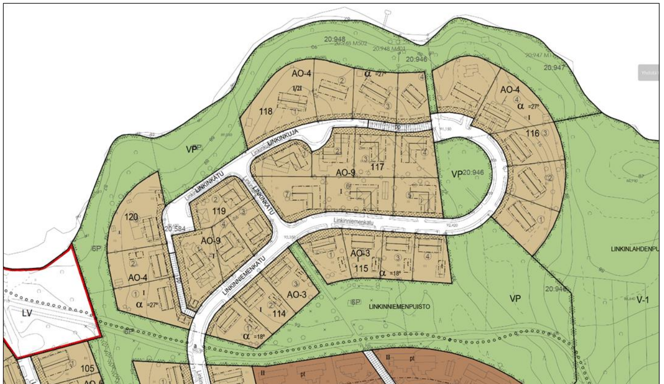
Kuva 4 Ote ajantasa-asemakaavasta.