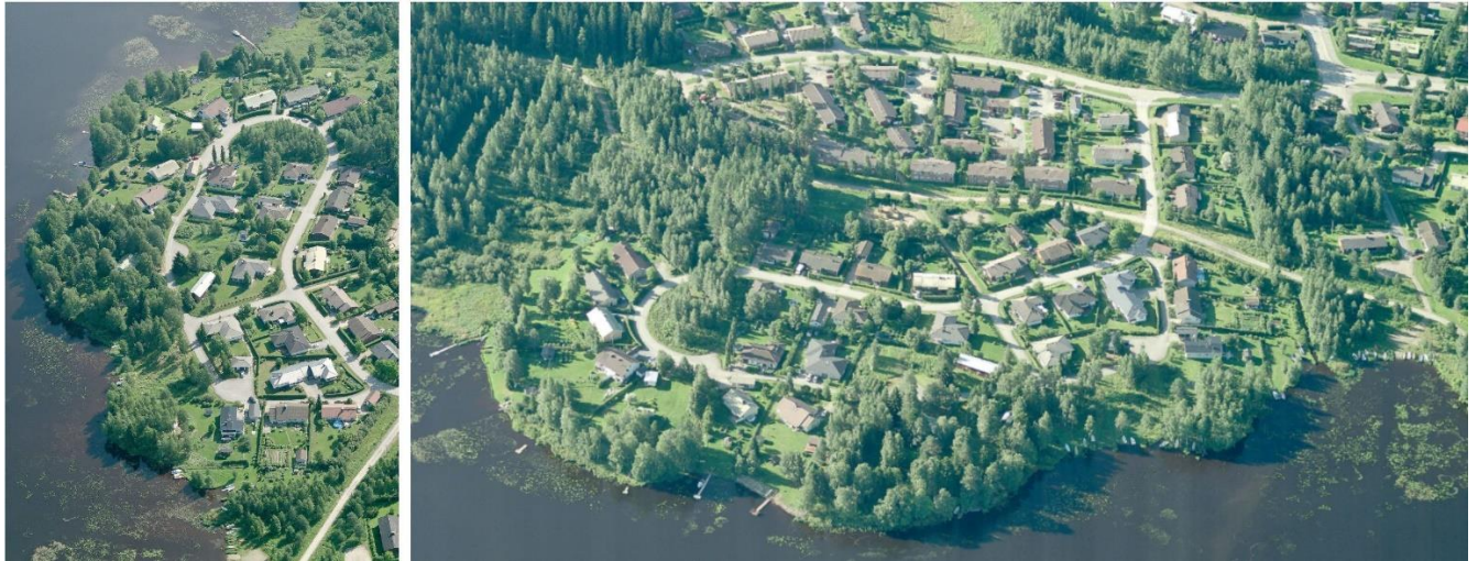
Kuva 3 Viistokuvanäkymiä Linkinniemen asemakaavamuutosalueelle 2011.