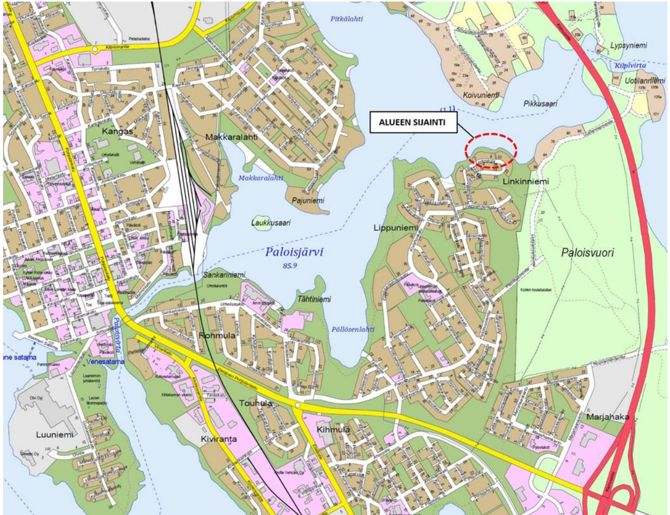
Kuva 1 Kaavamuutos ja laajennusalue sijaitsee Linkinniemessä, keskustasta noin 3 km koilliseen.

ASEMAKAAVA JA ASEMAKAAVAN MUUTOS, joka koskee 6. kaupunginosan korttelia 118 ja korttelin 116 pohjoisimpia tontteja sekä niihin liittyviä rannan puistoalueita, katu- ja vesialuetta.