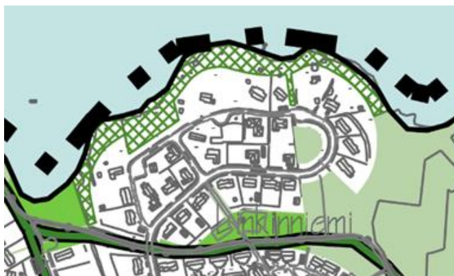
Kuva 6 Ote viheraluejärjestelmästä.